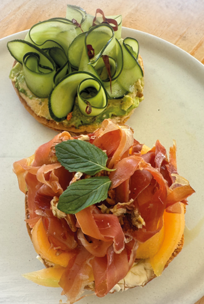
Jamón Serrano con Melón