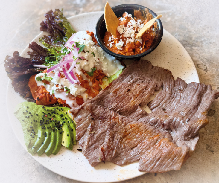
Plato de Cecina de Yecapixtla

Acompañados con rajas, guacamole, nopales y frijoles (2)