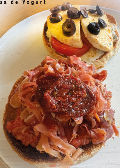
Jamón Serrano con Tomaquet