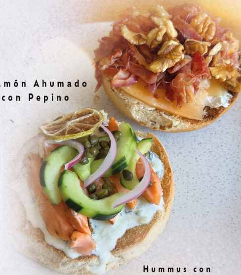
Hummus con Aguacate y Pepino