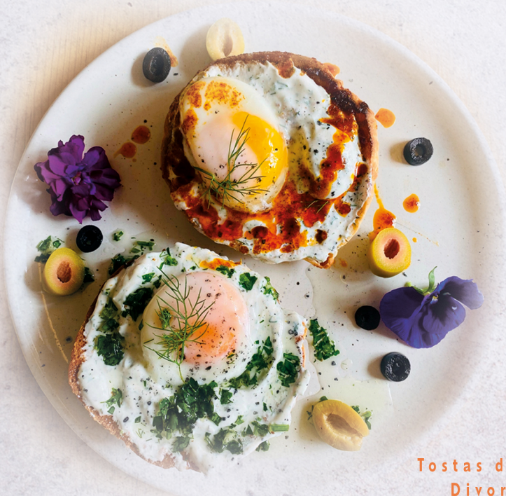
Tostas de Huevos Divorciados