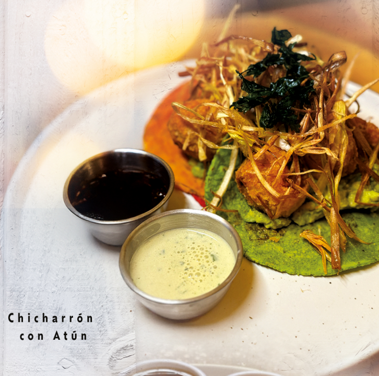
Chicharrón con Atún