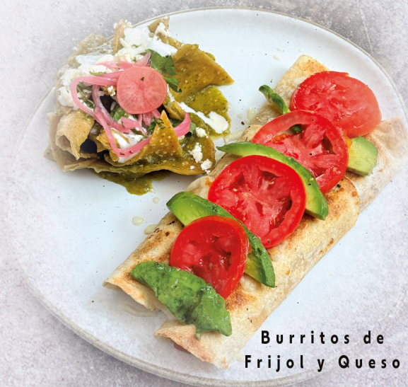
Burritos de Frijol y Queso