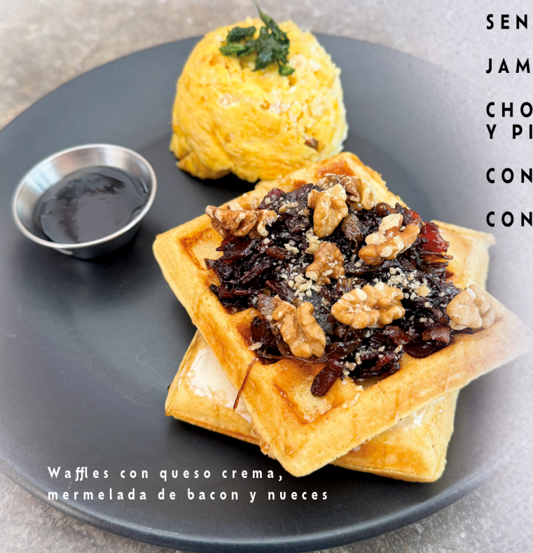
Waffles con queso crema, mermelada de bacon y nueces